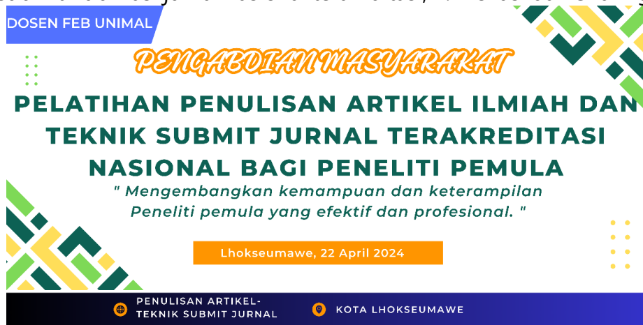
Gambar 1. Flyer dan Spanduk Acara Pelatihan

Adapun bahan pembelajaran yang diberikan pada saat pelaksanaan pelatihan di dalam gedung dan pasca kegiatan sebagaimana disajikan dalam Gambar berikut ini.