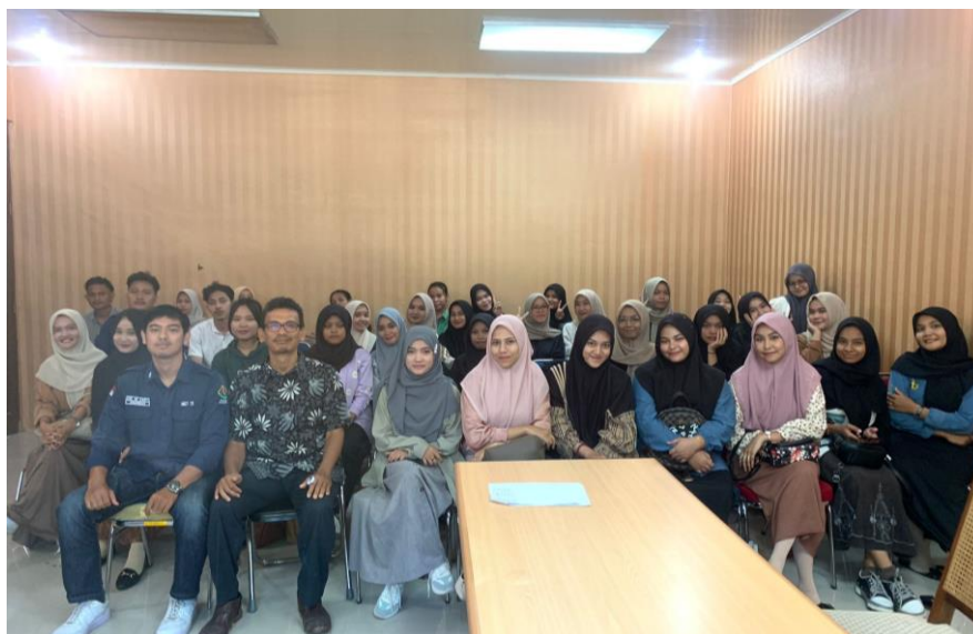
Gambar 4. Tim Pengabdian Kepada Masyarakat foto bersama peserta pelatihan penulisan artikel ilmiah serta submit jurnal